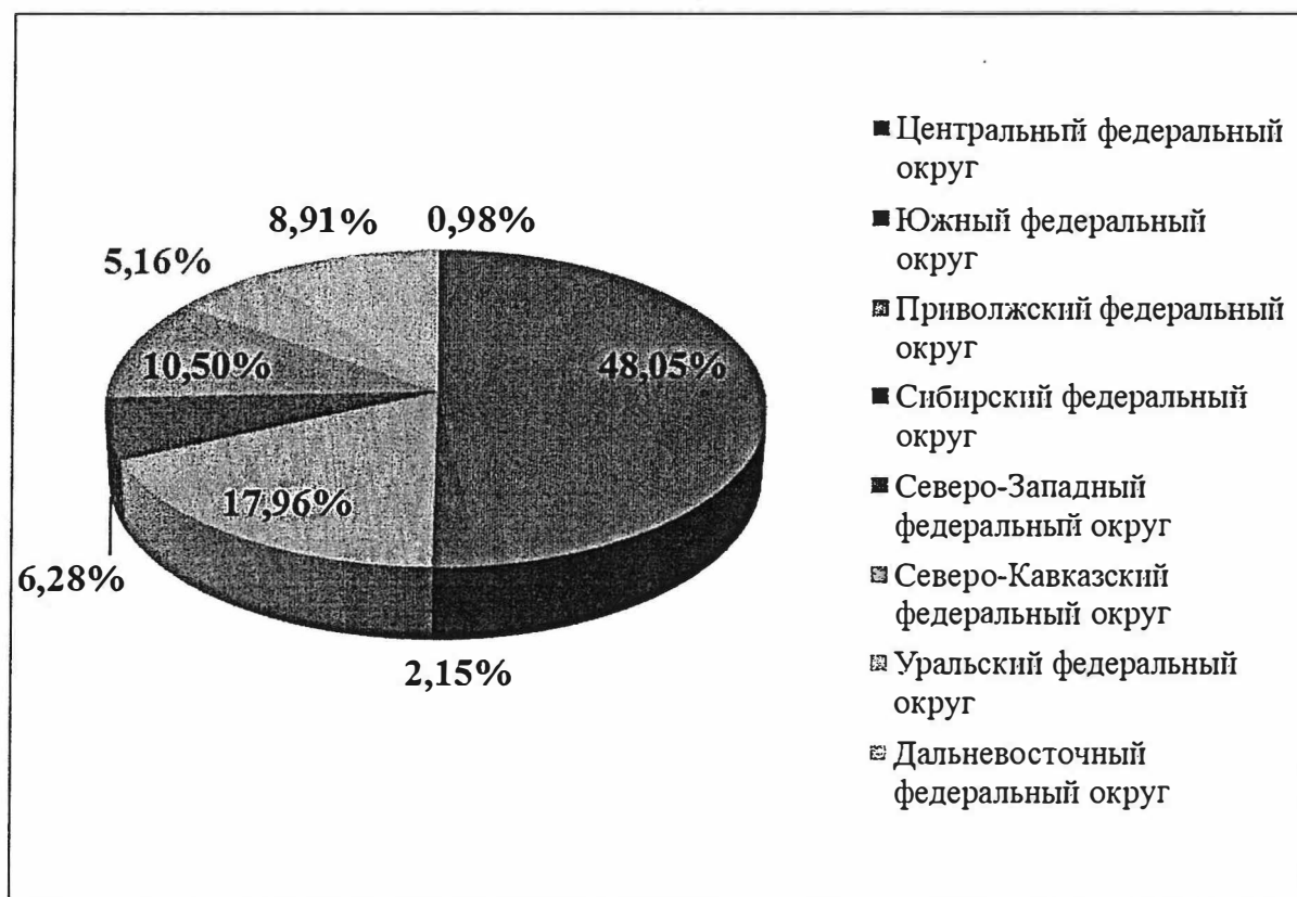
Рис. 1. Доля выпуска медицинских изделий, включая хирургическое оборудование, ортопедическое оборудование и их составные части, по федеральным округам

Объемы выпуска изделий медицинских за июнь 2014 года представлены на рисунке 1.